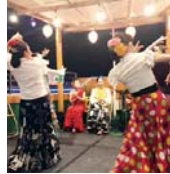
NEW ▶10/4～の第1・3水曜、13:00～14:15 ▶受講料:6回 11664円

フラメンコを手軽に楽しめる「スパニカ」が静岡から誕生しました!スペインの歌謡曲に合わせて、フラメンコ風に踊るリズムダンスで、身体が優れているため、激しそうな踊りながらもあきらめず、プリの良い軽快な曲に合わせて、カンパに全身を使って踊ることで、姿勢の改善や脳の活性化などに効果があります。9/20(水)、13:00～14:15 ▶受講料:1944円 ▶持ち物:動きやすい服装、運動靴(またはバレエシューズ)、飲み物 ▶講師:永井美穂子(フラメンコ舞踊家)