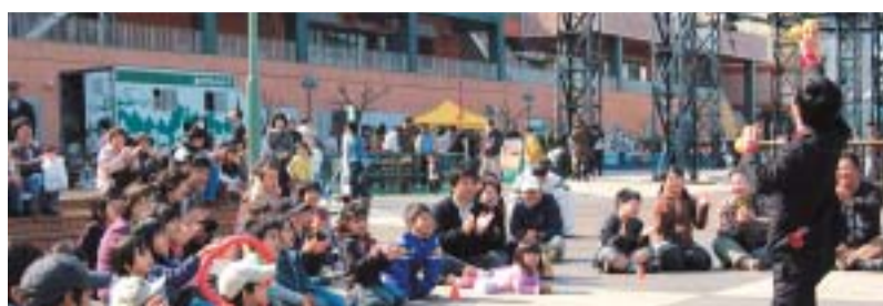
魅力ある人が動きだす