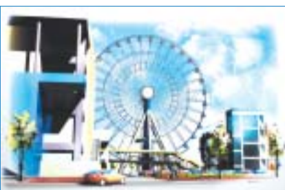
観覧車の完成予想図。「観覧車に名前を付けたら」という声にこたえ、愛称の公募が予定されている