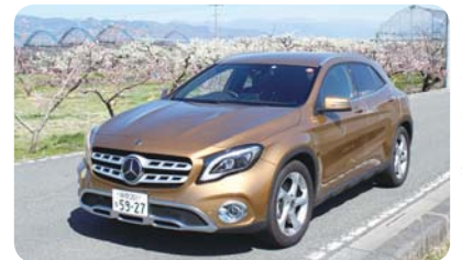
魅力あふれる山梨を快適ドライブ

【アクセス方法】新東名・新清水インターから車で約50分 (国道52号・身延町下山、上沢交差点から約800m) 【問い合わせ】山梨県富士川クラフトパーク ☎0556(62)5545 山梨県南巨摩郡身延町下山1597 公園は無休(各 施設は異なる) http://www.kirienomori.jp/