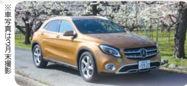
※車写真は3月末撮影

南アルプス市のおいしいフル ーツをPRするキャラクター、ぶ どうの妖精シャインちゃん