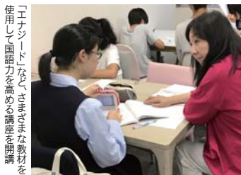
「10シスター」なく、さまざまな教材を使用して国語力を高める講座を開講